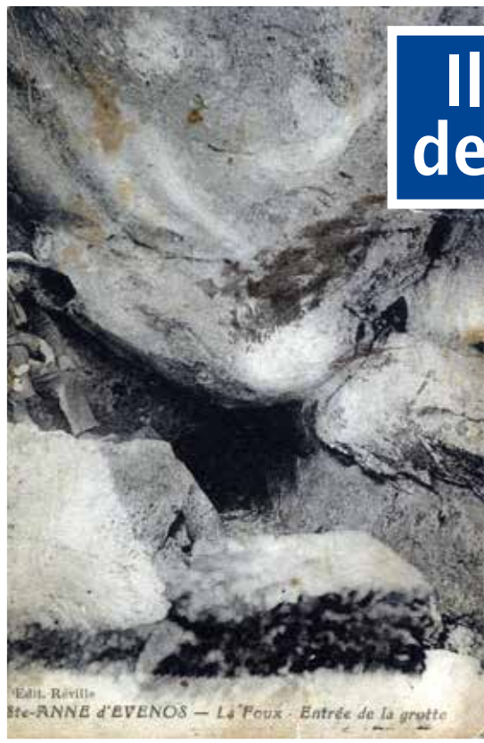
Édit. Révillat Ste-ANNE d'EVENOS — La Foux - Entrée de la grotte